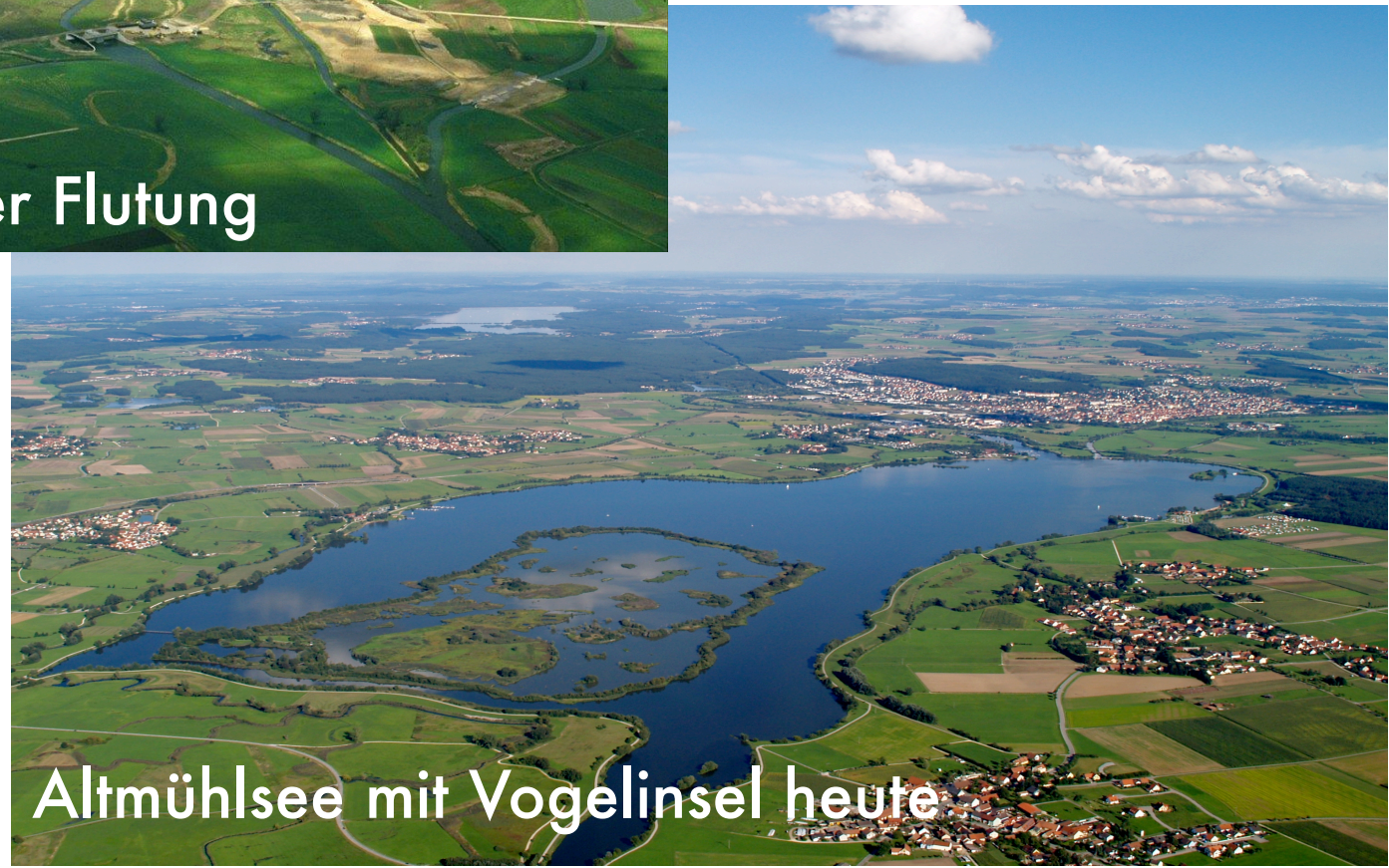
Altmühlsee mit Vogelinsel heute