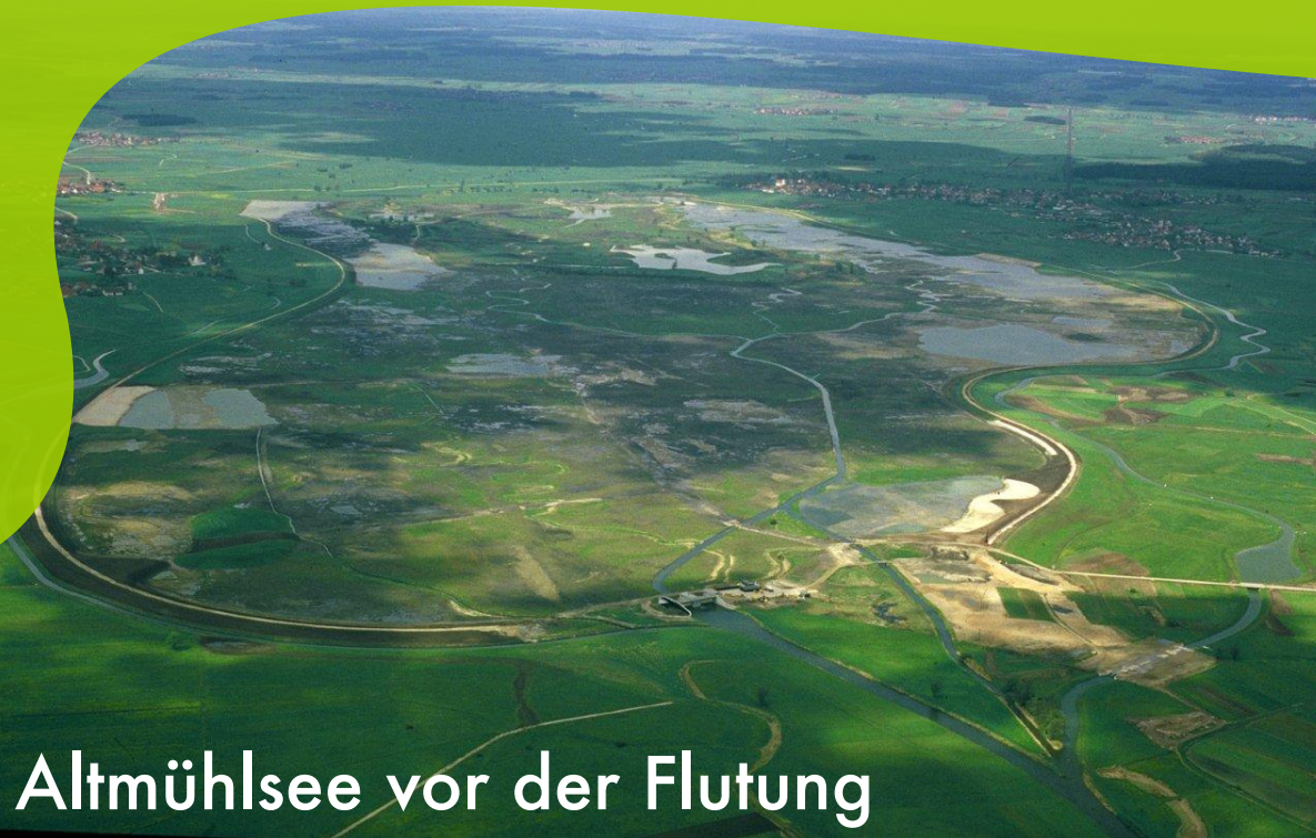
Altmühlsee vor der Flutung